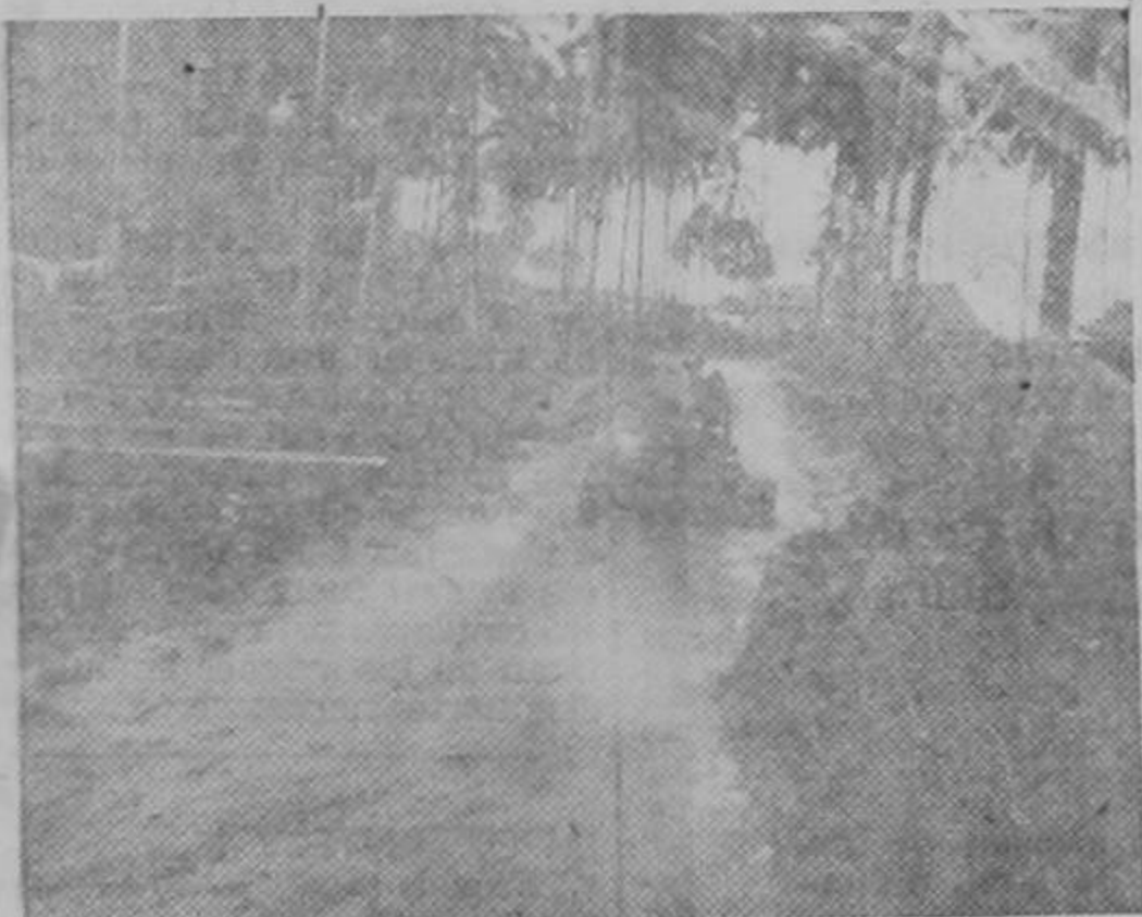
Un soldado del cuerpo de ingenieros navales de los Estados Unidos recorre un fangoso camino de la selva que pronto se convertirá en sólida carretera militar. El cuerpo de ingenieros sigue a las tropas de combate para construir bases modernas.

Como un homenaje a la memoria gratísima del doctor Moreno Caballero, tuvo lugar el domingo el acto que anualmente celebra frente a la tumba de aquel gran costarricense. La foto muestra el momento en que el Dr. don Sifón Núñez, secretario de salubridad pública, pronunciaba un sentido discurso frente a la multitud que se hallaba reunida junto a la tumba cubierta de las flores tributadas por el cariño y el recuerdo de aquel eminente ciudadano.