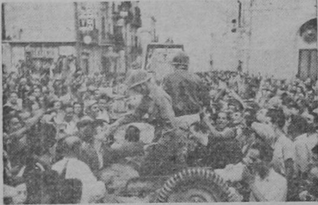
Obsérvese en esta fotografía la espontánea bienvenida dada a las tropas norteamericanas por los habitantes de un pueblo siciliano, después de haber expulsado a los nazis de ese lugar. La muchedumbre, llena de júbilo, se aglomera en las calles para celebrar su liberación del régimen fascista.

TREMENDOS DISTURBIOS EN LA CAPITAL DANESA SE HAN REGISTRADO Una revuelta podría favorecer una invasión aliada, dicen los corresponsales de prensa en Copenhague