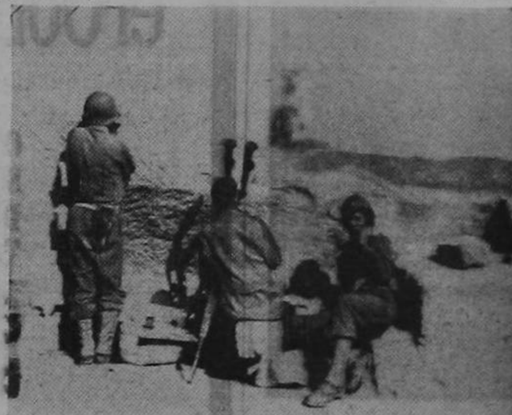
Soldados de los Estados Unidos en un puesto de observación de la línea de combate en Sicilia transmiten a la artillería que está a retaguardia datos sobre el efecto de su fuego. La explosión que se ve en las alturas del fondo denota que los disparos van dirigidos a ellas. La foto fué transmitida a Washington desde Argelia.