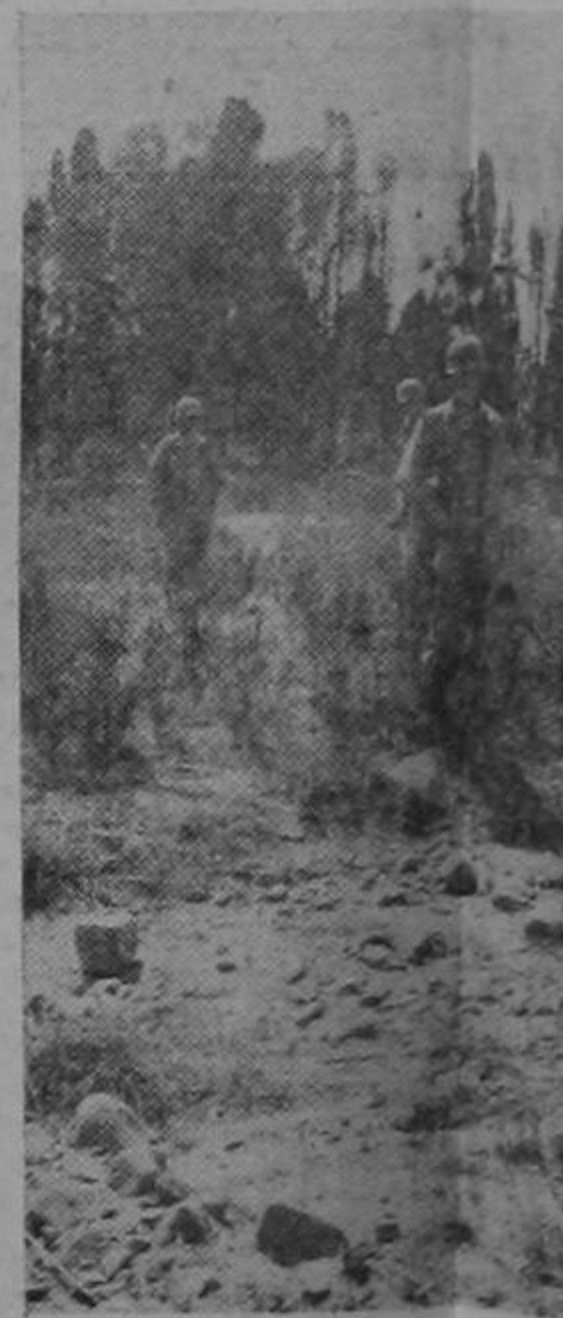
Una de las labores más peligrosas: la extracción de minas en el Eje en retirada. En la foto soldados de los Estados Unidos que a esta árdua tarea para despejar avance a medida que el campo de