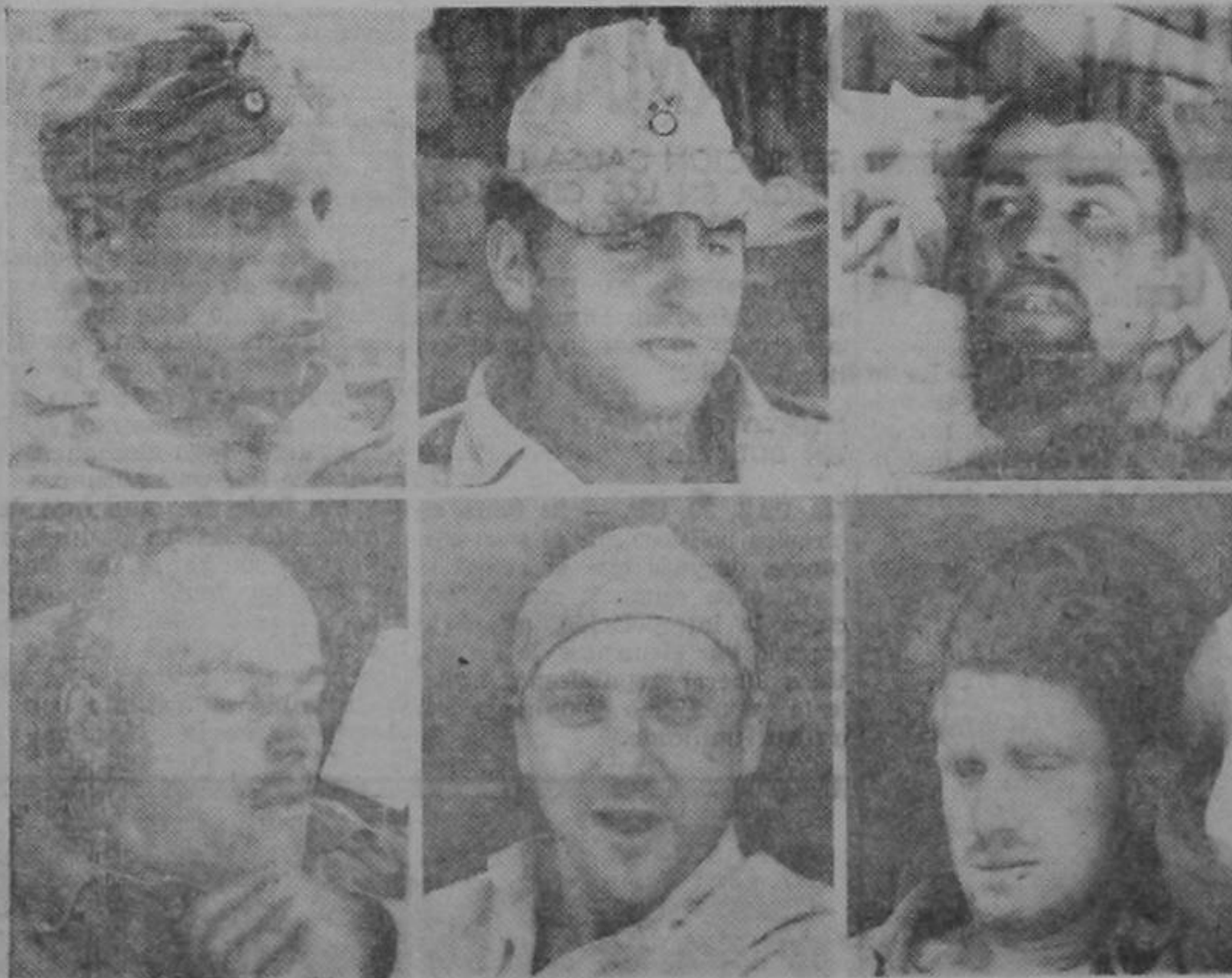
Perdida ya su jactancia de superhombres, estos soldados nazis aguardan pacientemente en Sicilia a un transporte norteamericano que habrá de conducirlos a un campo de concentración.