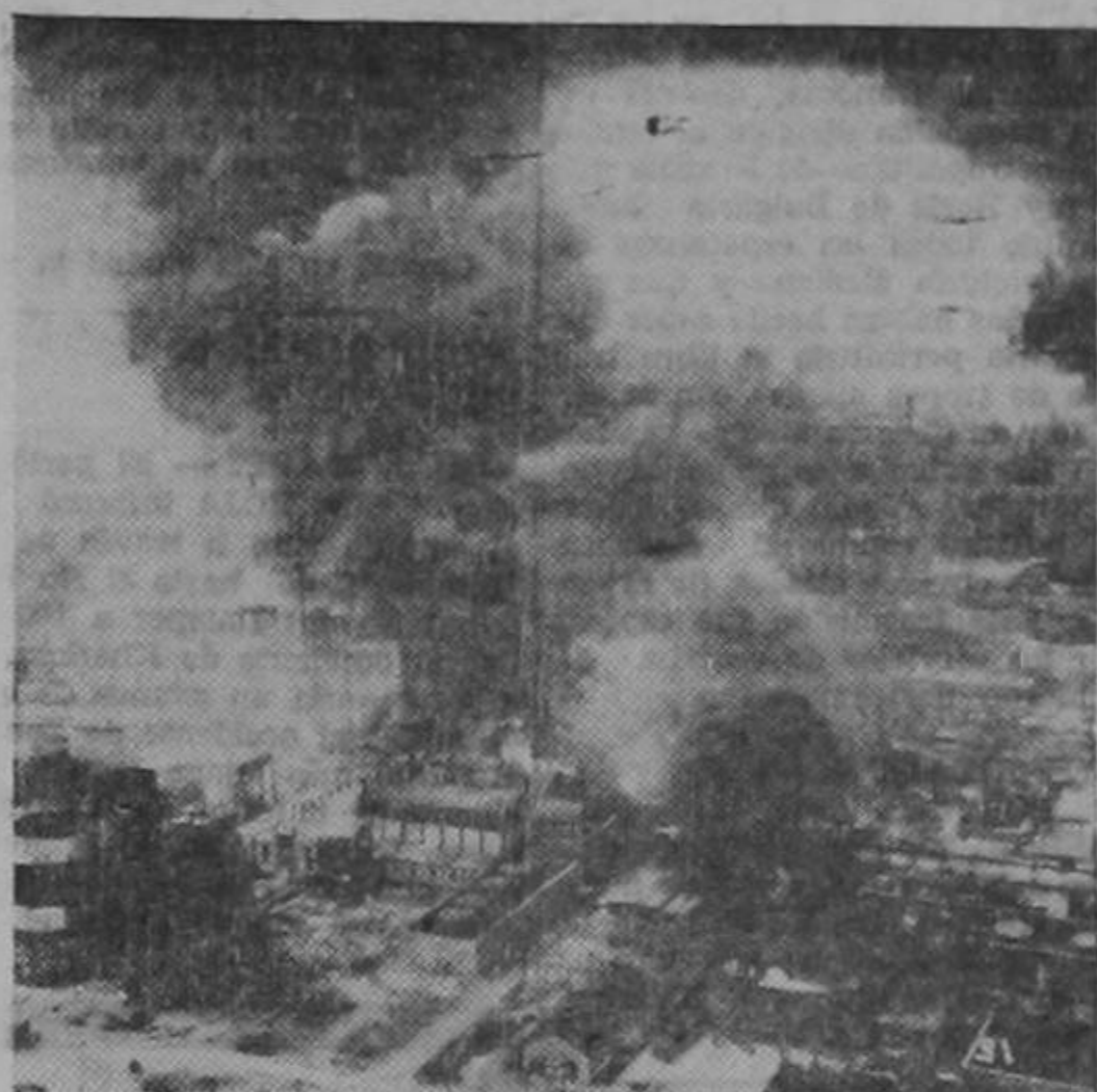
Esta foto fué tomada desde un bombardero del ejército estadounidense y muestra los depósitos y refineries de petróleo de Ploesti, Rumania, presa de las llamas después de un serio bombardeo diurno. Si bien fueron considerables las pérdidas en bombarderos, pues ejecutaron el ataque a baja altura, se logró inutilizar por varios meses una de las pocas fuentes que abastecen de petróleo a los nazis.