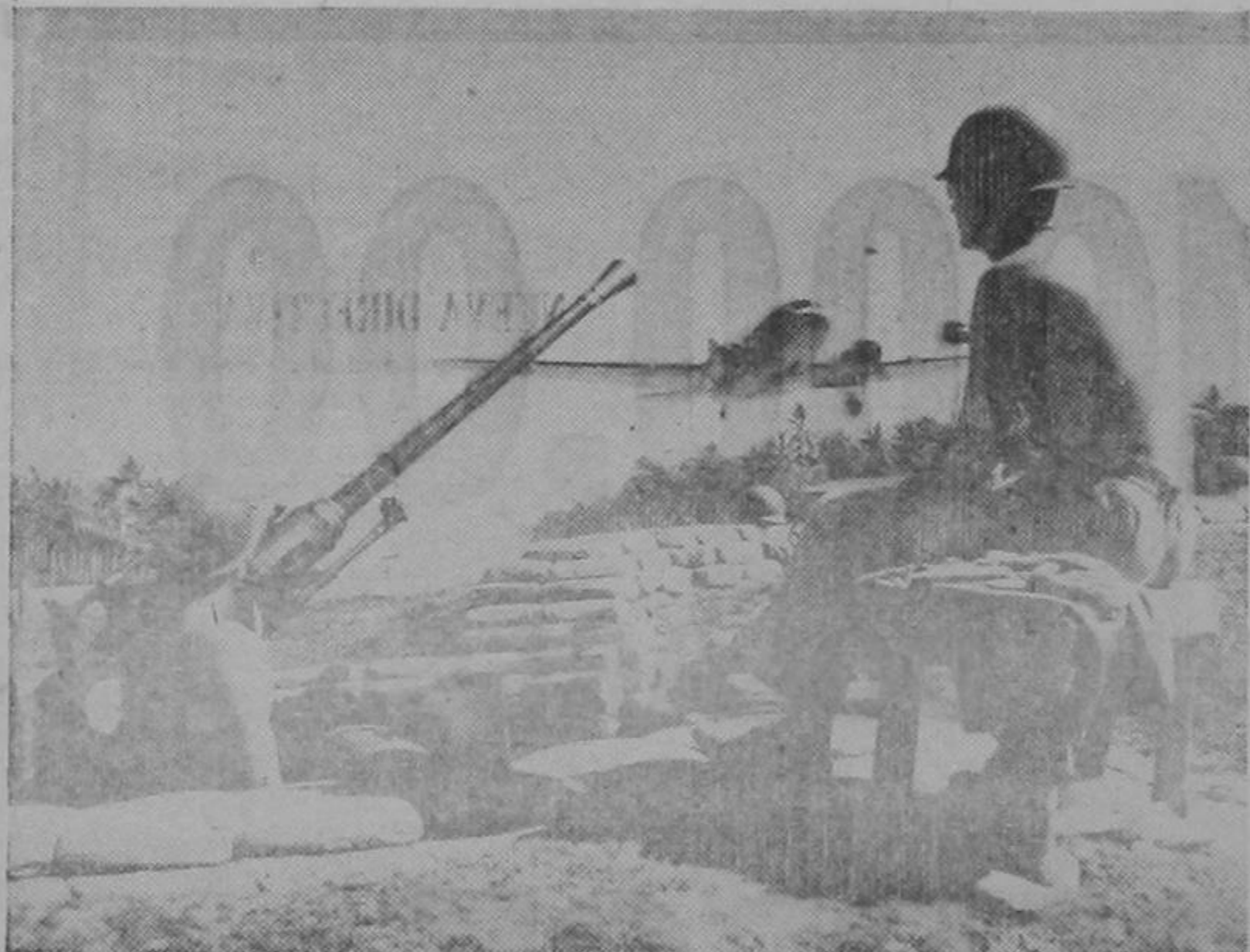
Artilleros estadounidenses de guardia en una base recién capturada de una isla del Pacífico, mientras que un avión militar de transporte despegaba de un aerodromo que ha sido rápidamente construido. Esta base se capturó en el curso de la actual ofensiva en el sudoeste del Pacífico.