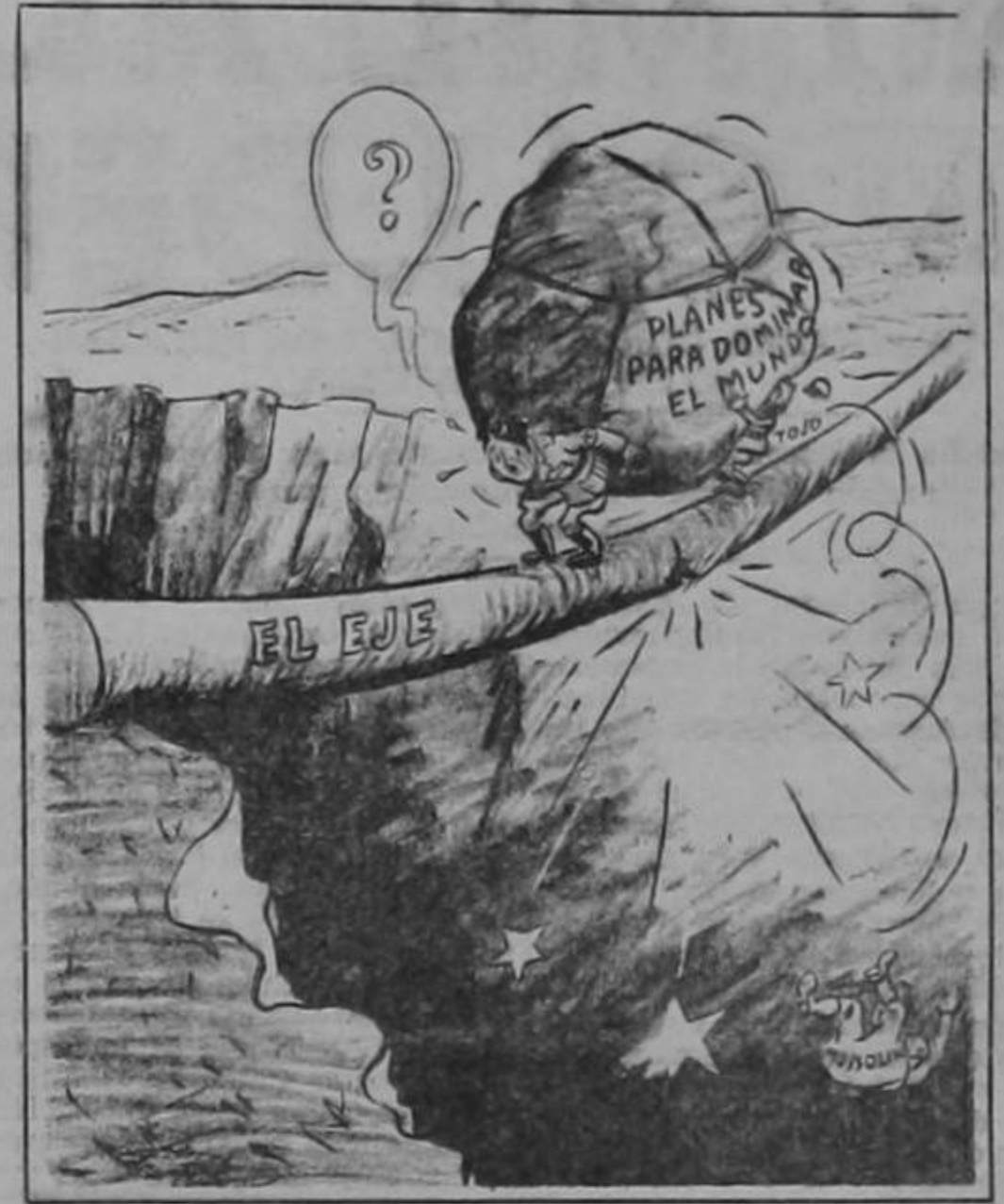
Carmack en el Chicago News.