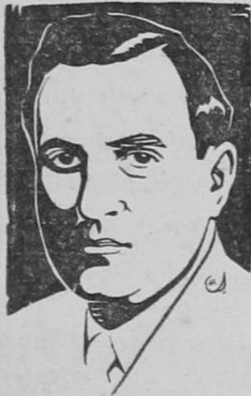
Dr. CALDERON GUARDIA

Los alajuelenses y heredianos quisieron testimoniar en forma clara su reconocimiento a esa eficaz obra de bienestar social de la presente administración y todos los grupos sindicales de trabajadores del campo y de la ciudad se congregaron, desfilando desde la Plaza del Pacífico hacia la ciudad y luego, hacia la plaza Acosta donde se levantó una tribuna desde la que hablaron los representantes de varias asociaciones obreras y finalmente el señor Presidente de la República, doctor Calderón Guardia, quien hizo una larga exposición de su política social y de sus proyectos para el futuro. Lo mismo